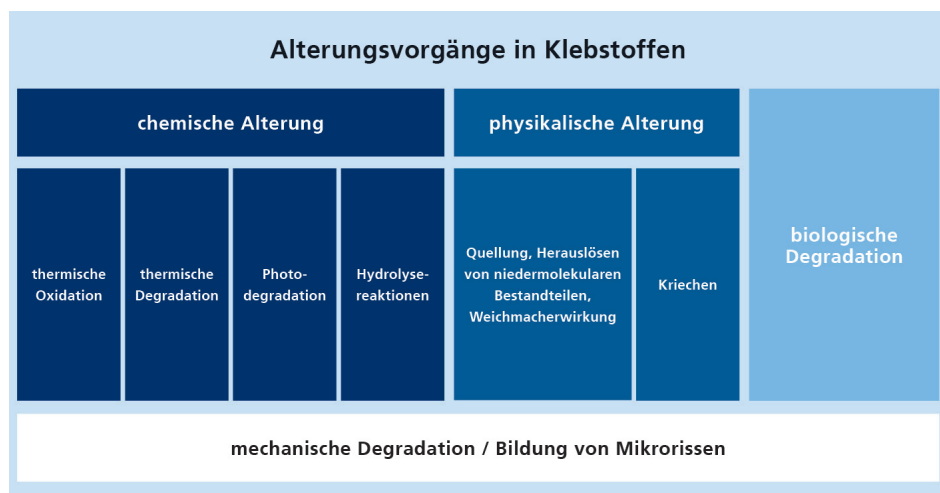
Übersicht über Alterungsvorgängen in Klebstoffen.

Das Wissen um Alterungsvorgänge und deren Beeinflussung ist ein wesentlicher Baustein für zuverlässiges Kleben. Das Fraunhofer IFAM in Bremen unterstützt Sie gerne bei Ihren spezifischen Anwendungen.