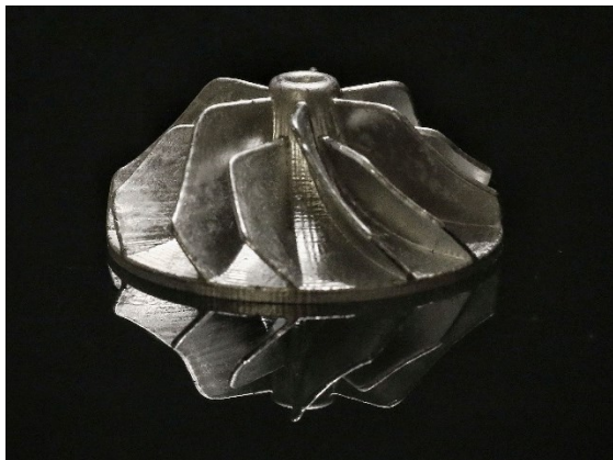
Sinterteil eines Impellers, hergestellt mit GelCasting

Weitere Informationen zu Additiver Fertigung am Fraunhofer IWS.